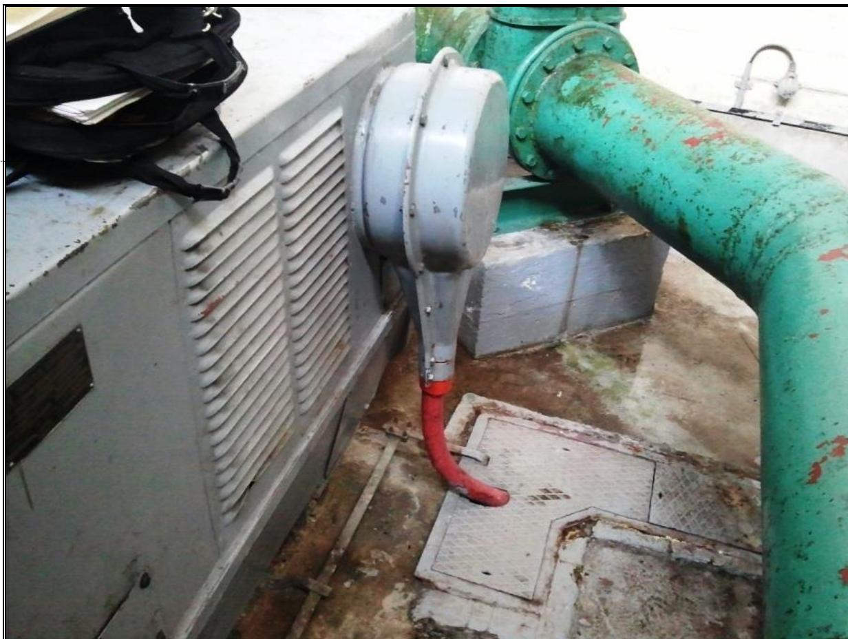
Слика број 4 - Кабловски прикључак старог мотора