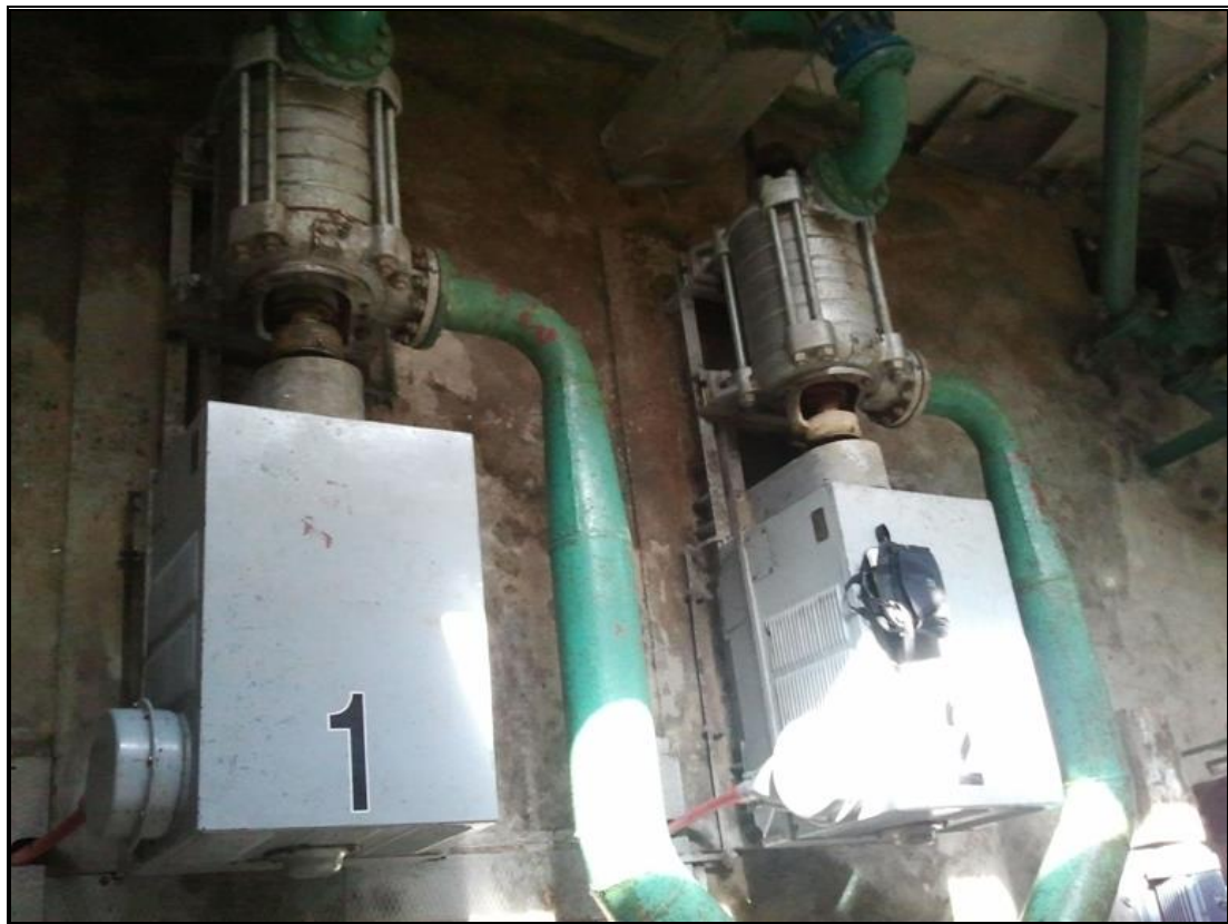
Слика број 2 - Пумпна станица чисте воде (поглед одозго)